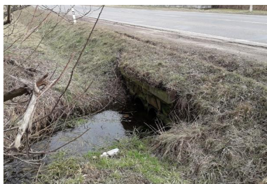
Obr. 1. – Pohled na vtokové (obr. vlevo) a výtokové (obr. vpravo) čelo propustku

Základem opravy propustku je tedy důkladné pročištění všech příkopů v dostatečném rozsahu. Rovněž bude nutné provést pročištění potrubí.