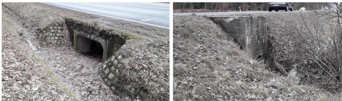
Obr. 2. – Pohled na vtokové (obr. vlevo) a výtokové (obr. vpravo) čelo propustku

Z hlediska technického stavu byly zjištěny průsaky mezi prefabrikáty Beneš. Propustek je zanesený, ale stále ještě funkční. Čelo propustku tvořené betonovým blokem je pevnou překážkou. Obě čela propustku jsou pokryta mechem a vegetací. Celkově je propustek v dobrém stavu.